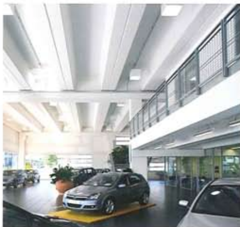
Interni della concessionaria con il pavimento grigio asfalto Graniti Fiandre e il soppalco Interiors of the dealer with asphalt gray floors Graniti Fiandre and mezzanine

Seen from the outside, the body of the building, divided in two parts, is characterized by an arcaded passage that, like the driving force of the project, identifies the entrance to the two halls. The two colors, white and gray, distinguish the two units that, while connected physically, may exist autonomously, both as it is arranged at this point in time and in case the building should be converted to other uses in the future. The external surfaces, fences, profiles and gates feature details of an industrial kind.