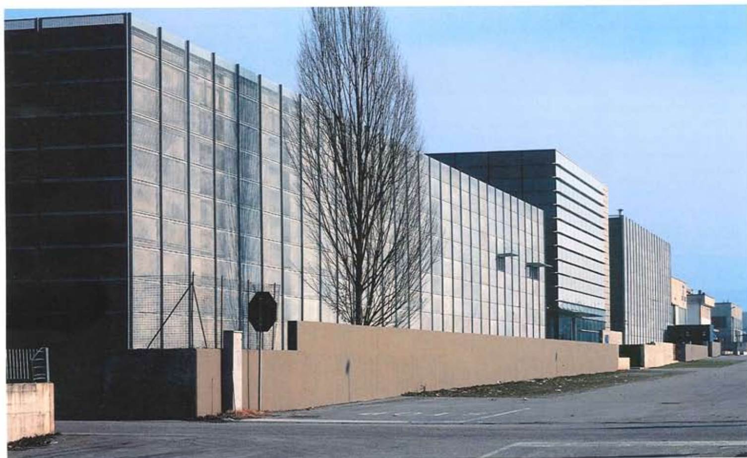
Esterno dell'edificio industriale Mair Research a Schio caratterizzato dal sistema di curtain-wall Nordisa, Permastelisa Group Exterior of the Mair Research industrial building in Schio, characterized by the curtain wall system Nordisa, Permastelisa Group

Oggi si impone all'attenzione dell'architetto il tema interessante dal punto di vista compositivo e progettuale dei "nuovi luoghi", cioè di quei nuovi temi di architettura che in passato non esistevano e che nella contemporaneità si sono resi necessari per i cambiamenti sociali, economici e tecnici che sono avvenuti. È il caso ad esempio dei centri commerciali, dei cinema multisala, delle fiere, ma più in generale dell'architettura di tutti gli impianti che richiedono spazi a forte connotazione tecnica. In queste occasioni l'architetto deve costruire autonomamente un itinerario legittimo che, snodandosi attraverso i rapporti con la tradizione, anch'essa sempre da rintracciare e da argomentare, con i contesti e con i funzionamenti, susciti il progetto o quanto meno produca i dati di un plausibile approccio progettuale.