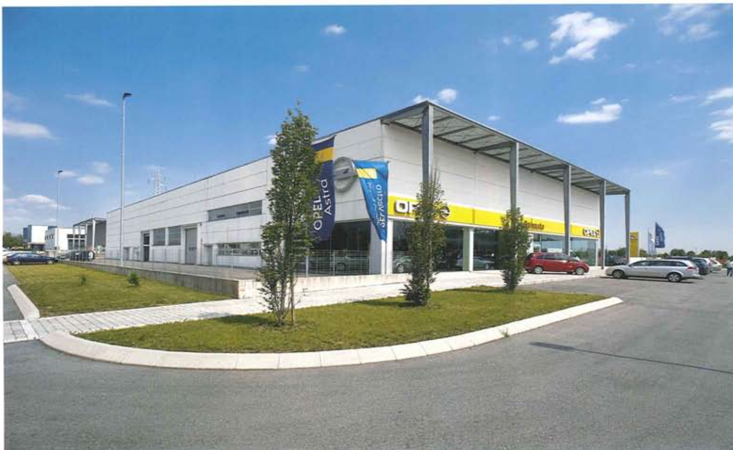
Vista della concessionaria Opel della Galvauto a Schio View of the Galvauto Opel dealer in Schio

Il secondo edificio, appena inaugurato, la nuova concessionaria OPEL per la ditta Galvauto srl (via Lago Trasimeno, 45 e via Lago di Costanza a Schio Vicenza), punta soprattutto sulla funzionalità e sul servizio al cliente. Oggi l'auto richiede una concessionaria contemporanea. Vendere un'auto è vendere moda ma non solo. Lo studio orizzontale delle vetrine senza nessun tipo di interruzione permette ai titolari dell'azienda di evidenziare immediatamente il prodotto al visitatore passante.