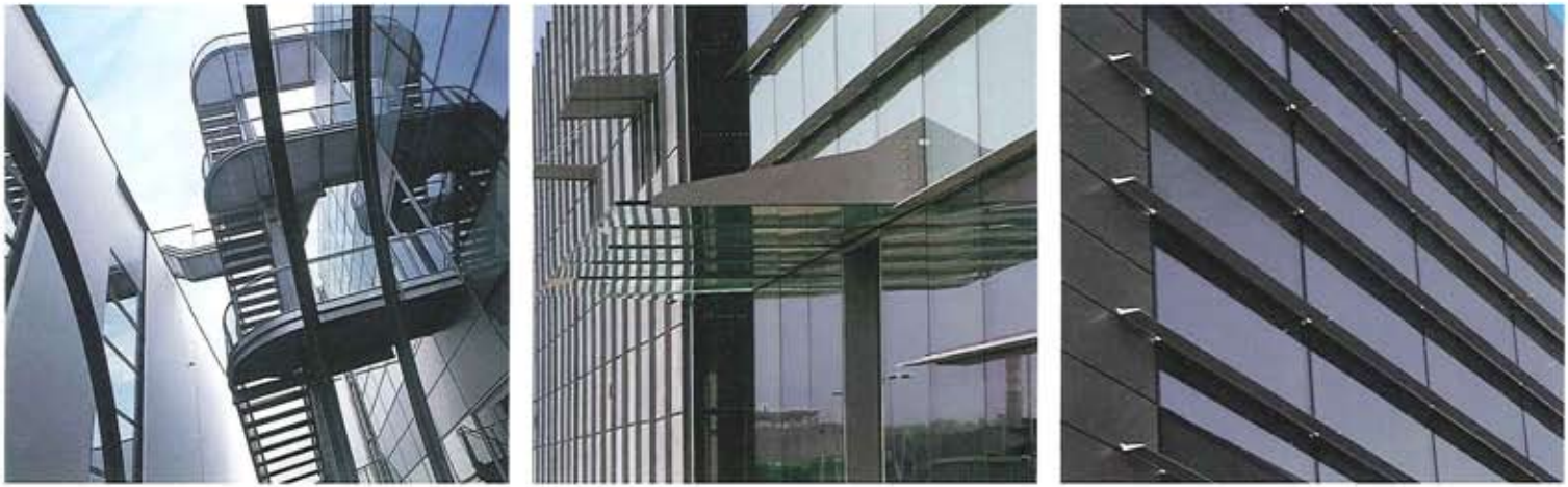
Dettagli delle facciate in vetro e del frangisole Detail of the facades in glass and the sunscreen

Il tema degli spazi destinati alle concessionarie per le auto e delle nuove strutture industriali fanno parte di questa nuova generazione di luoghi da "inventare" e ha avuto la fortuna di incontrarsi con la migliore architettura mondiale in virtù del grande sviluppo economico del settore e dell'interesse, anche dal punto di vista del marketing, per un'immagine fortemente legata alle più alte espressioni dell'arte e della cultura. L'immagine della concessionaria esige oggi un'architettura adeguata che ben la rappresenti. I due progetti che presentiamo dello Studio Chilò sono ubicati a Schio, nel vicentino, crocevia di strade, di tessuti urbani e di imprenditorialità.